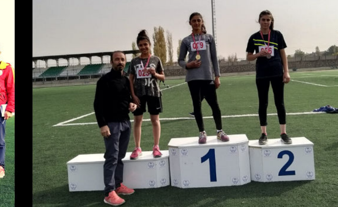
KIZLAR BİREYSEL ATLETİZM-İĞDIR ŞAMPİYONU