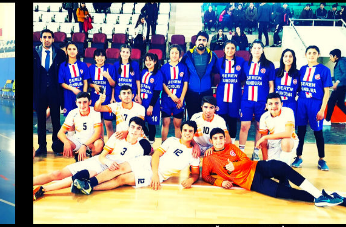
OKUL HENTBOL TAKIMI-İĞDIR ŞAMPİYONU