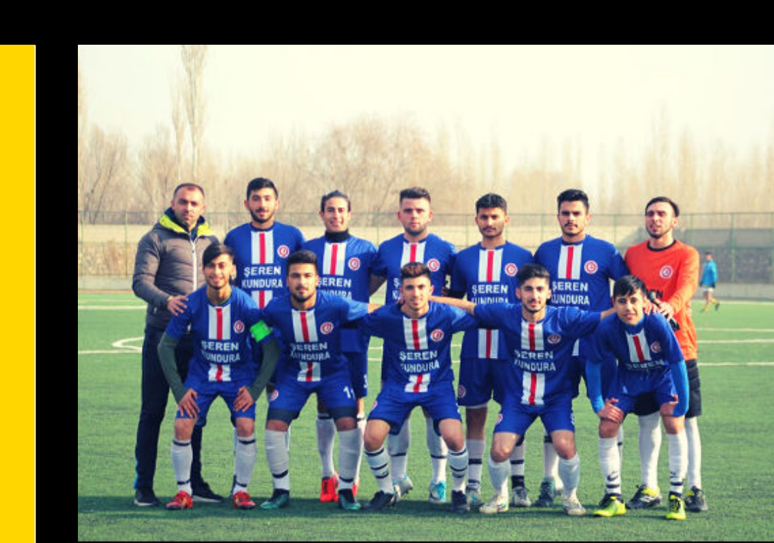
ERKEK FUTBOL TAKIMI-İĞDIR ŞAMPİYONU