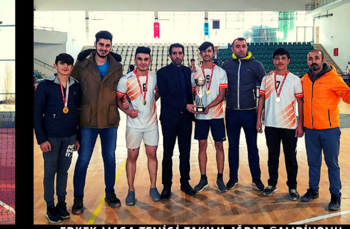
ERKEK MASA TENİSİ TAKIMI-İĞDIR ŞAMPİYONU