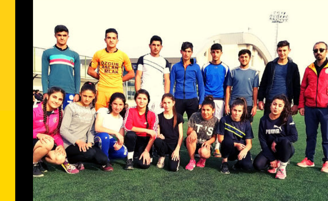
OKUL ATLETİZM TAKIMI-İĞDIR ŞAMPİYONU