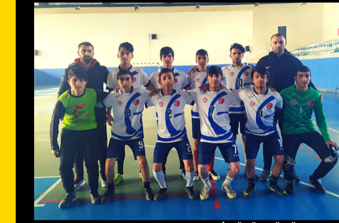
ERKEK FUTSAL TAKIMI-İL ÜÇÜNCÜSÜ