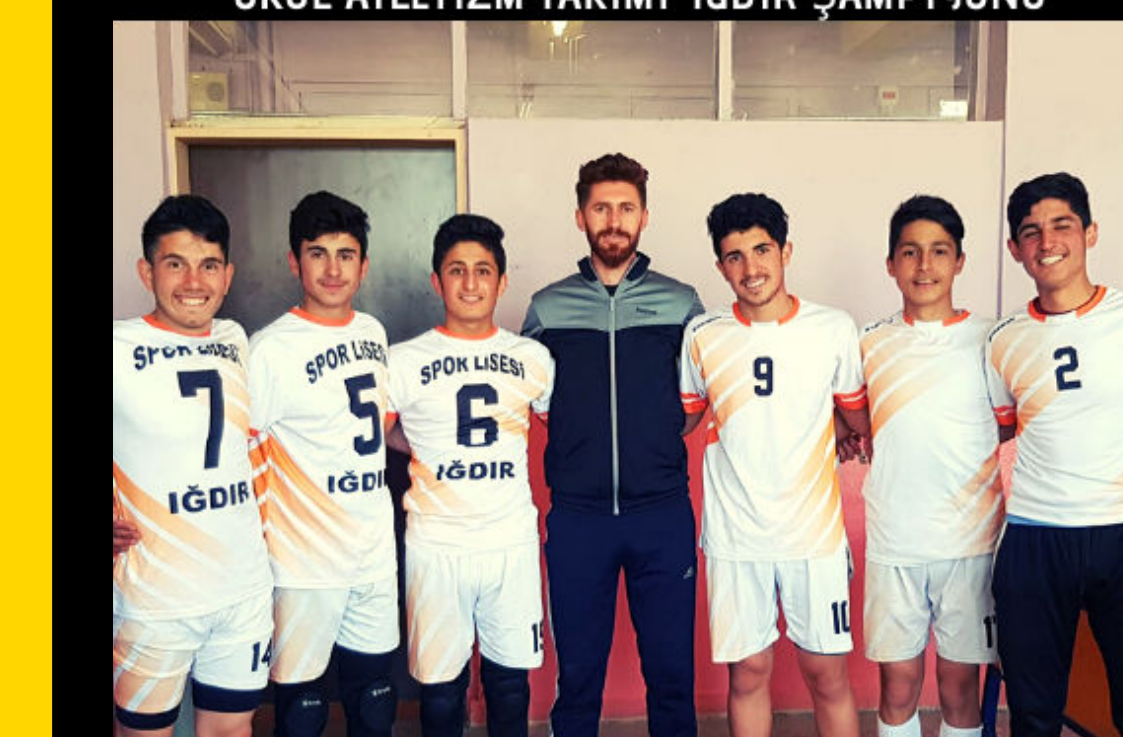
ERKEK VOLEYBOL TAKIMI