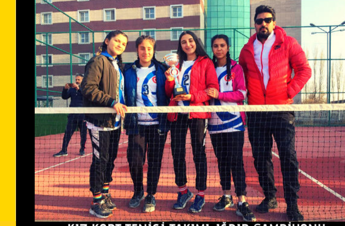
KIZ KORT TENİSİ TAKIMI-İĞDIR ŞAMPİYONU