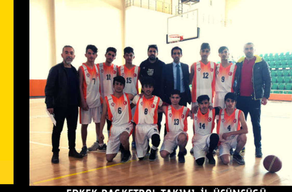
ERKEK BASKETBOL TAKIMI-İL ÜÇÜNCÜSÜ