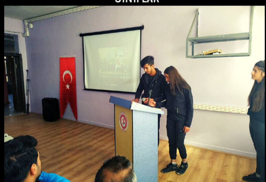
ÇOK AMAÇLI SALON