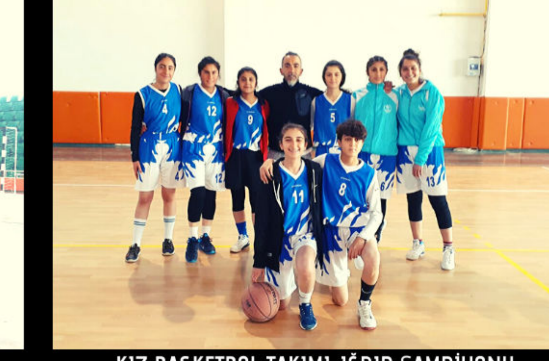
KIZ BASKETBOL TAKIMI-İĞDIR ŞAMPİYONU