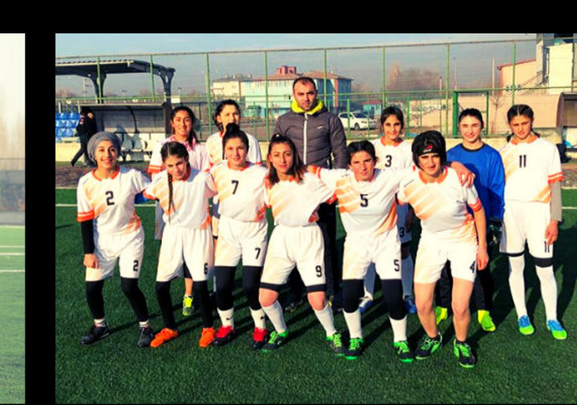
KIZ FUTBOL TAKIMI-İĞDIR ŞAMPİYONU