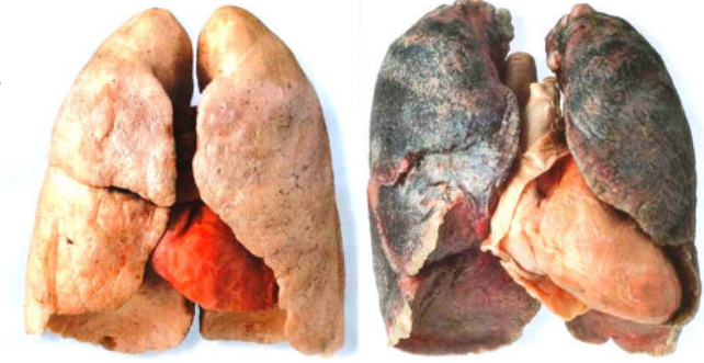
SİGARA İÇMEYENLERİN AKCİĞERİ